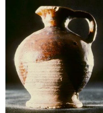
toulon xix e siècle

Pour toutes précisions : www.chateauderatilly.fr